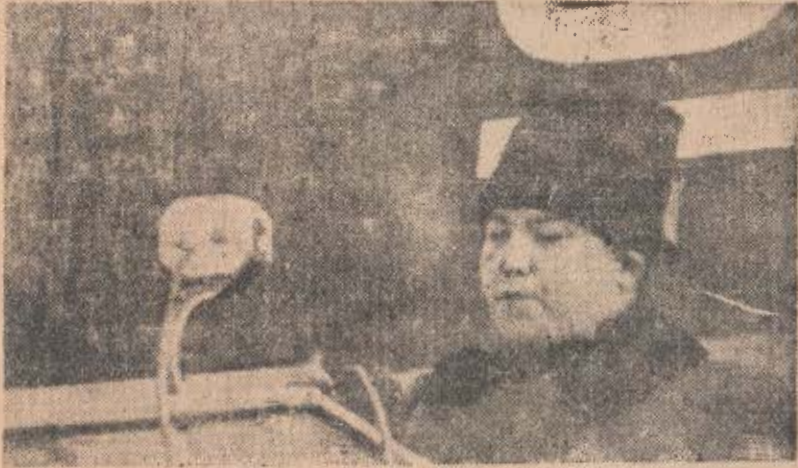
閱兵式場에서 演說하시 는 金日成委員長